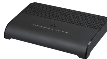
RG-5520G-Wax rev.B/RG-5520G-Wax-Z rev.B

RG-5520G-Wax/Wax-Z — двухдиапазонный Wi-Fi роутер с гигабитными портами LAN Ethernet и 2.5 гигабитным портом WAN Ethernet с мощным двухъядерным процессором. Устройство поддерживает стандарт 802.11ax, который работает одновременно с двумя потоками, обеспечивая скорость до 1.201 Гбит/с на диапазоне 5 ГГц. Использование технологии MU MIMO позволяет сделать устройство универсальным решением для организации корпоративных сетей.